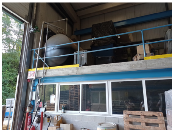
Depósito de gasóleo

El presente documento ha sido finalizado en Eibar, a 31 de mayo de 2024