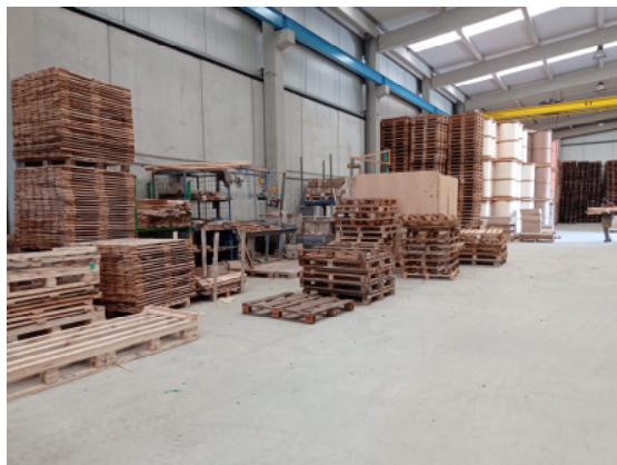
Zona de almacenamiento de palets en reparación