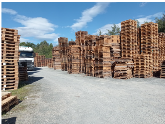
Almacén zona exterior